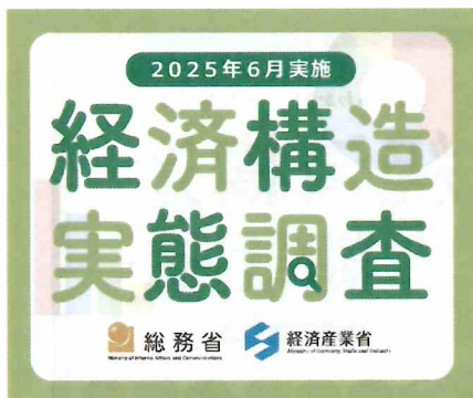
300 × 250 px