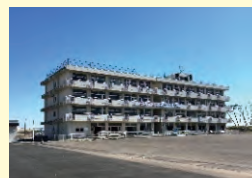
⑤ 震災遺構・荒浜小学校