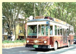
④ 定禅寺通り・るーぷる仙台