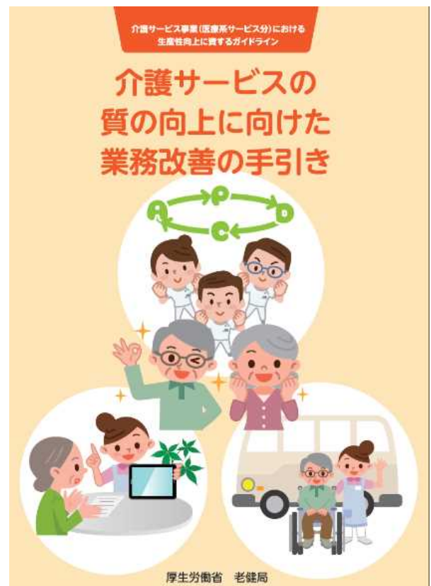
図1 「介護サービスの質の向上に向けた業務改善の手引き」表紙 （出所）厚生労働省ホームページ

https://www.mhlw.go.jp/stf/shingi2/0000198094_00013.html